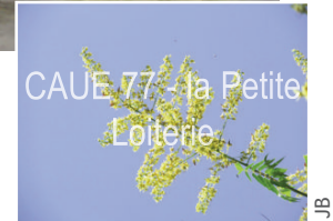
Flurs en panicules (30 à 45 cm)