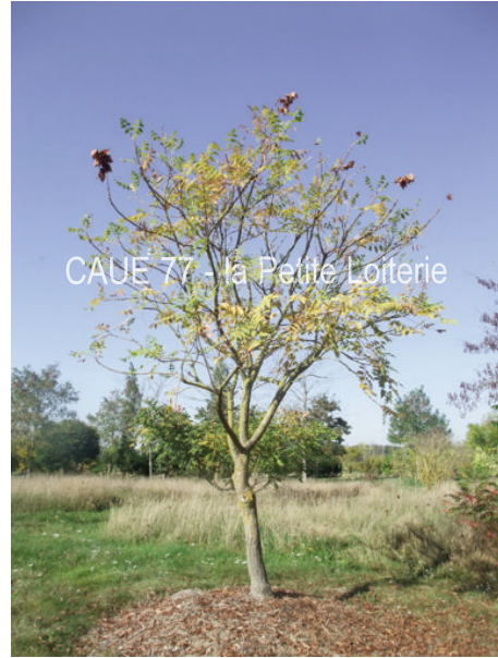
Koelreuteria paniculata 'September Globe'

Koelreuteria paniculata 'September Globe' moins courant, a une floraison plus tardive (septembre, d'où son nom) Koelreuteria paniculata 'Fastigiata' a un port très érigé quand il est jeune, mais il s'ouvre plus ou moins ensuite, et ses insertions de branches sur le tronc sont souvent fragiles. Des tailles en vert permet de maîtriser cette tendance à l'ouverture.