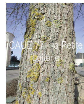
Ecorce avec fines fissures