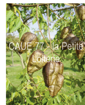
Capsules contenant 3 graines