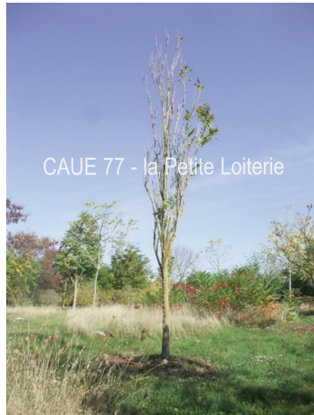
Koelreuteria paniculata 'Fastigiata'